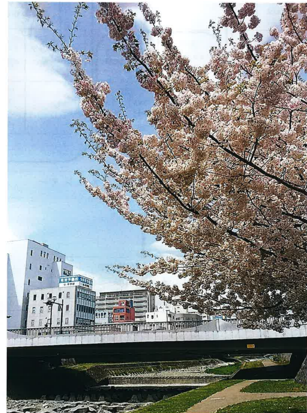
秦野市は、神奈川県内一長い桜並木「はだの桜みち」をはじめ、弘法山、カルチャーパーク近隣と、桜の見どころがたくさんあります。この時期、秦野市内は桜色に染まります。