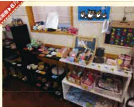
ゆめ散歩の店内には市内施設の商品がたくさん！

また近くで運営する、ともしびショップ「ゆめ散歩」では福祉のアンテナショップとして市内の様々な福祉施設で製作した商品や観光協会の推奨品などを販売しています。併設された公園では地域の方々とイベントを開催したりして地域交流の場としても注目されています。 秦野を訪れた際はぜひ美味しい食事を楽しんでお土産を買いに訪れてみてはいかがでしょうか。