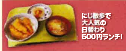
にじ散歩で大人気の日替わり500円ランチ！