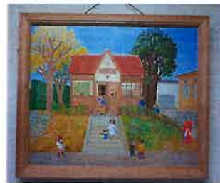
郵便局 秋 つゆき 正和 作