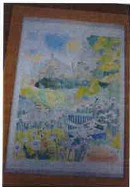
アン女王のレースフラワー 守安 ふみ 作

ぱれっと・はだのでは、 障害をお持ちの皆さんの 描いた絵や写真を展示して います。 通称「ぱれっと美術館」。 1階交流室、2階相談室、 階段などにありますので、 ぜひご覧ください。 本誌掲載希望の作品も大募 集です！(秦野市在住の 障害のある方対象) ぱれっと・はだの地域活動 支援班までお問い合わせ ください。